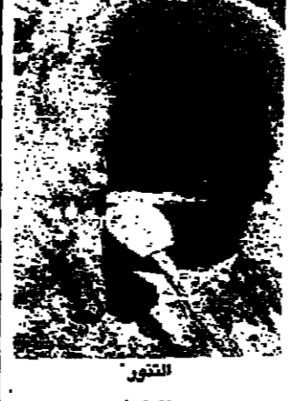
صور - الأنوار

وصف فستانته في تلك موضوعا للشهيد الرئيس رشيد كرامي، فلان في عهد أي العصر الحكومي وبعد ساعة تمكنت في جلسة مع أفراد من الرئيس الشهيد أسيرت له كل ما جرى فليفتني بأنه قبل أن يلتقي به ويعرف مضمون حوار مع المفتي الشهيد كان قد اتصل به وهناك بسلامة وكان حديثا طريا لطفيا بيننا. واعتبر الرئيس كرامي المفتي خالد سيانا أنه كان لطفيا معه بسبب معرفته بالحوار فتسنى علي إيضاح الصورة أمام المفتي، وهكذا كان وكما يظل القلوب شواهد... وكان من نتائج هذه الخطوة جلسات أخوية بين الشهيدين ببلد في العلاقة بين دان القدي والقرى الحكومي. ولكن الزمات عديدة مرت على اللبنانيين منها أزمة الريف والطين والغاز والمحروقات، استطاع اللبناني أن يتخطاها بما لديه من خبرة وفكرة على التصرف.